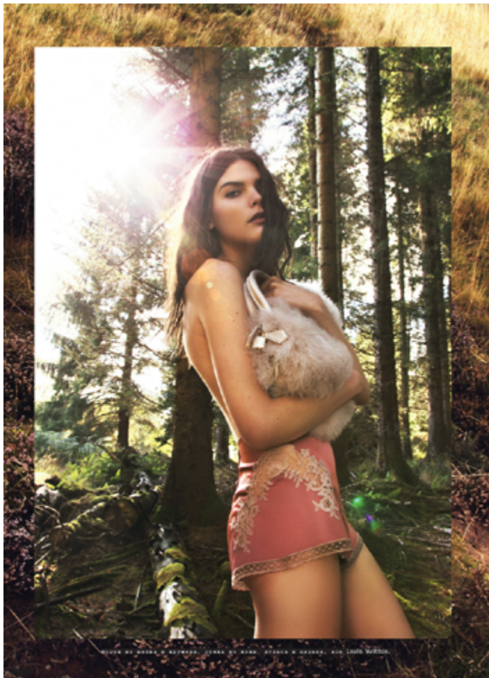
СЮИТА ДИ ДЖЕНА И РАЙМОНД. ТРАКА ДИ РАНО. СТАСКА И БРАНСИ. СКА ЛУИВ ВУЛФОН.