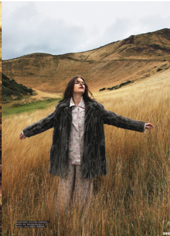
СЮИТА ДИ ДЖЕНА И РАЙМОНД. ТРАКА ДИ РАНО. СТАСКА И БРАНСИ. СКА ЛУИВ ВУЛФОН.